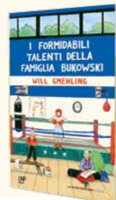
Will Gmehling I FORMIDABILI TALENTI DELLA FAMIGLIA BUKOWSKI (La Nuova Frontiera, 192 pagine, 16,50 €)

A NOSTRO PARERE: ciò che ci fa amare la famiglia Bukowski è la sua banalità (sempre che l'amore sia banale), la fragilità della vita e della felicità, le difficoltà del presente, i progetti perseguiti con tenacia e l'ostinata fede nel futuro.